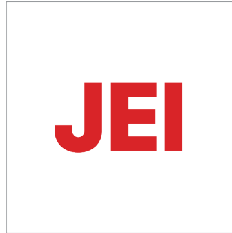
재능Red Color Logo

JEI CI 로고는 사용되는 다양한 환경에서 가시성을 유지하고 명확하게 식별될 수 있는 색상으로 변경하여 활용한다.