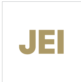
Gold Color Logo